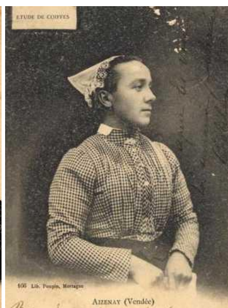
Ancienne église d'Aizenay (Vendée), Agésinate en costume et coiffe