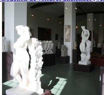
- Abbaye Royale de Saint-Michel-En-L'Herm (Vendée) - Musée André Deluol à Saint-Michel-en-l'Herm (Vendée)