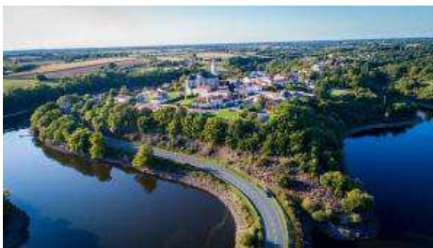
La presqu'île du bourg de Château-Guibert et le lac de la Moinie et du Tourteron (Vendée)